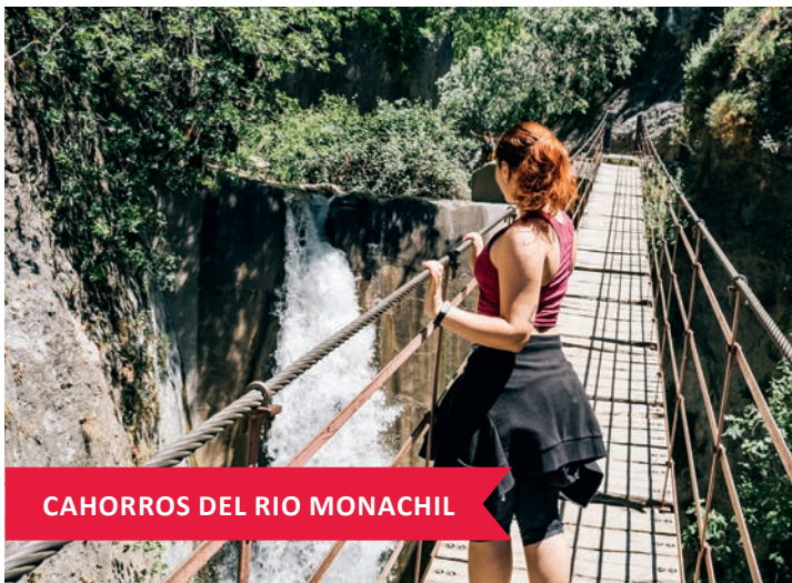
CAHORROS DEL RIO MONACHIL

In unmittelbarer Nähe von Granada befindet sich das Dorf Monachil, von dem aus ein Wanderweg zu den atemberaubenden Schluchten der Cahorros del río Monachil führt. Der Weg ist ca.